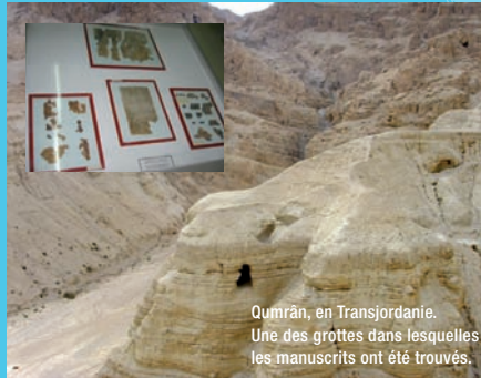
Qumrân, en Transjordanie. Une des grottes dans lesquelles les manuscrits ont été trouvés.